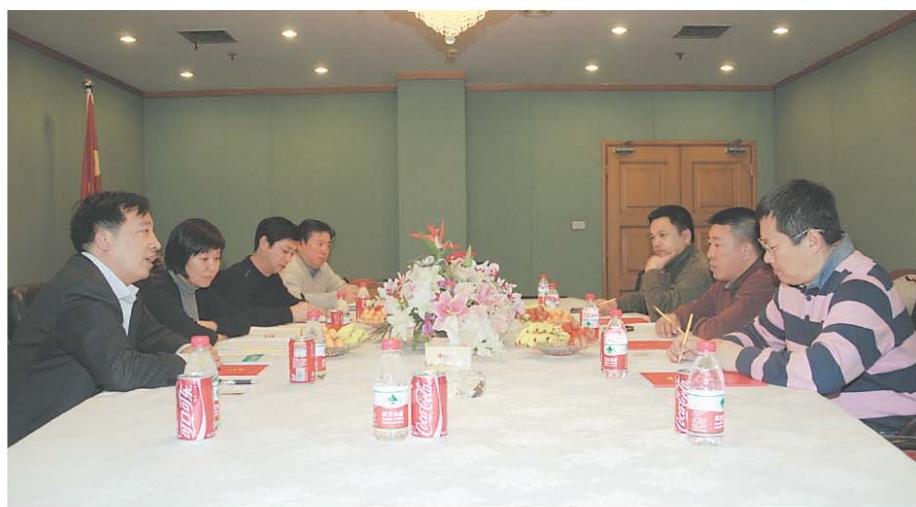
东粮集团与大成糖业达成初步合作意向

2月20日,东粮集团召开人力资源体系会议。会议主要是围绕人力资源体系2012年度重点工作,贯彻培训人力资源体系制度;分析体系管理中存在的问题,研究解决措施;并就规范表单、流程、文档、数据汇总等工作提出具体要求。东粮总部人力资源及五常、方正、肇源等园区的人力资源体系工作人员共11人参加了此次会议。(赵洪英)