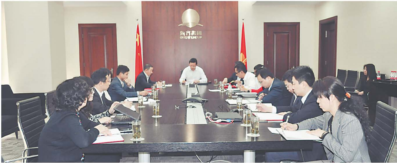
集团召开2012年计划落实推进工作会议