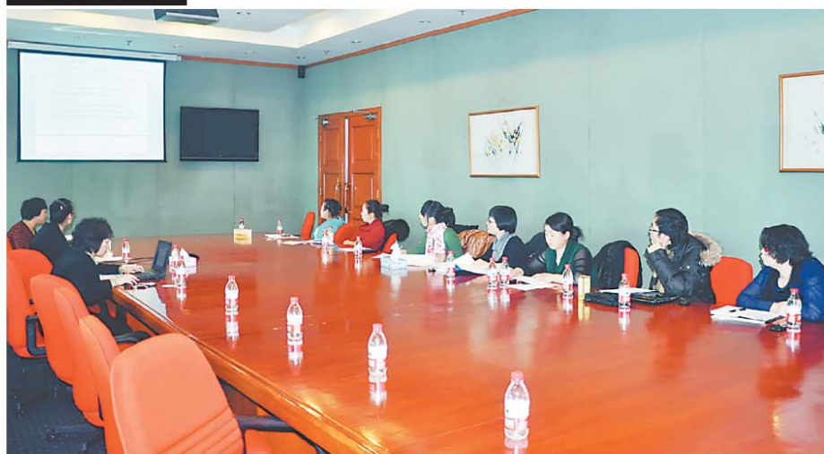
东粮集团召开2012年人力资源体系会议

2月20日,东粮集团召开人力资源体系会议。会议主要是围绕人力资源体系2012年度重点工作,贯彻培训人力资源体系制度;分析体系管理中存在的问题,研究解决措施;并就规范表单、流程、文档、数据汇总等工作提出具体要求。东粮总部人力资源及五常、方正、肇源等园区的人力资源体系工作人员共11人参加了此次会议。(赵洪英)