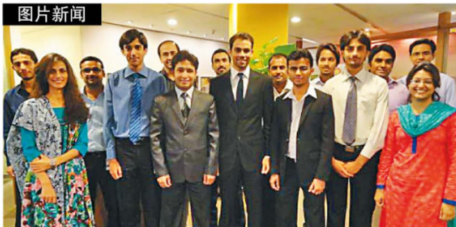
联合能源巴基斯坦有限公司新进培训生

联合能源巴基斯坦有限公司每年都会有针对应届毕业生的两年培训计划。今年有 1300 名毕业生申请，在严格的考试和面试后，16 名毕业生脱颖而出。经过能力测试、性格测试、小组面试等层层筛选，最后的优胜者都是巴基斯坦和国外著名大学的毕业生。培训生计划有利于根据公司业务需要培养未来的油气人才，同时也为巴基斯坦提供了青年就业机会和技能培训。 (杨眉)