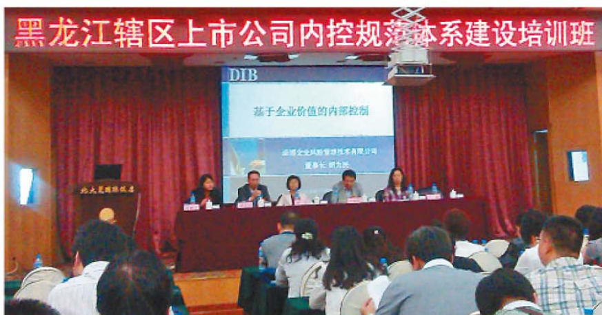
黑龙江证监局内控规范体系建设培训班现场

内部控制是指由公司董事会、监事会、经理层和全体员工实施的、旨在实现控制目标的过程，内部控制的目标是合理保证公司经营管理合法合规、资产安全、财务报告及相关信息真实完整，提高经营效率和效果，促进企业实现发展战略。根据《中国证券监督管理委员会公告[2011]41号》文件规定：“境内外同时上市的公司应当按照《企业内