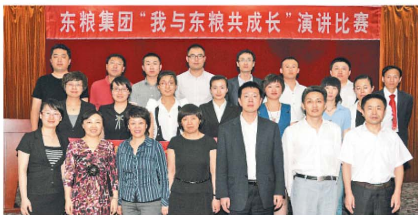
演讲比赛评委与15位演讲者合影

通过本次比赛，选手们充分挖掘身边优秀的人和事，通过生动、具体、典型的事例，诠释着东粮人“刚韧、无畏、探求、超越”的精神内涵，每个点滴都映射着东粮人顽强奋斗、开拓进取的精神面貌！通过选手们深情而精彩的演讲，我们的内心受到了强烈的震撼，我们相信有东粮人如此坚定的信念和满怀激情，东粮的明天一定会更好！本次活动对员工感受企业精神，融入企业发展起到了积极的促进作用。