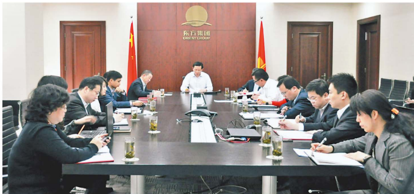
东方集团四月份月度工作会议现场

矿业公司要制定长远发展规划，根据四月勘探结果，重新制定五月的勘探计划，以长远规划为主，做