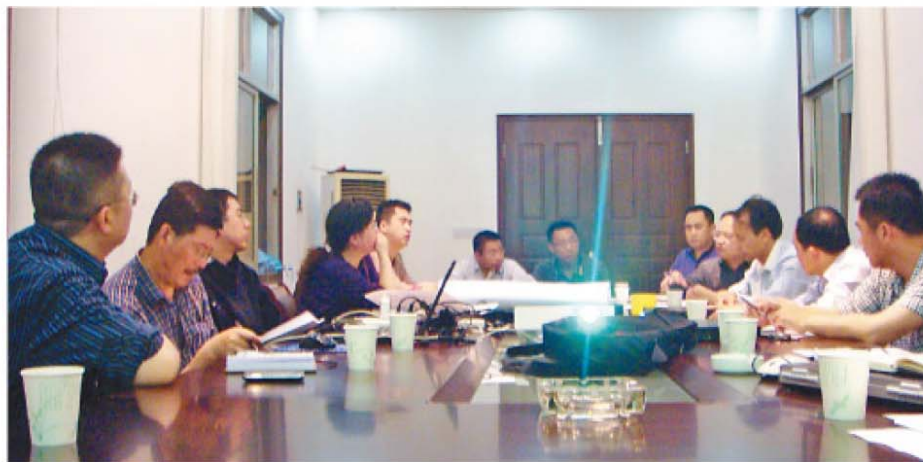
彭泽矿业公司与中金建设召开技术会有序推进工程进度

联合能源巴基斯坦有限公司每年都会有针对应届毕业生的两年培训计划。今年有 1300 名毕业生申请，在严格的考试和面试后，16 名毕业生脱颖而出。经过能力测试、性格测试、小组面试等层层筛选，最后的优胜者都是巴基斯坦和国外著名大学的毕业生。培训生计划有利于根据公司业务需要培养未来的油气人才，同时也为巴基斯坦提供了青年就业机会和技能培训。 (杨眉)