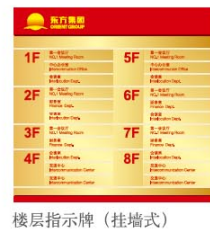
楼层指示牌（挂墙式）